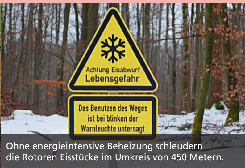
Ohne energieintensive Beheizung schleudern die Rotoren Eisstücke im Umkreis von 450 Metern.