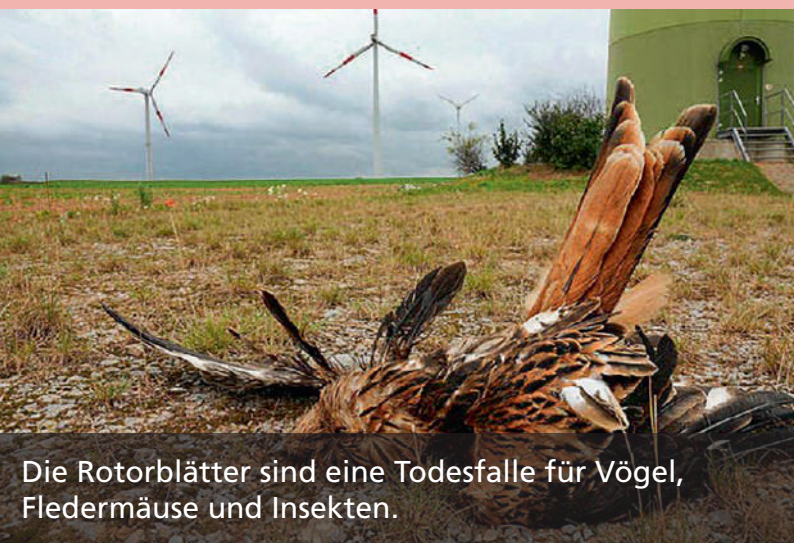
Die Rotorblätter sind eine Todesfalle für Vögel, Fledermäuse und Insekten.