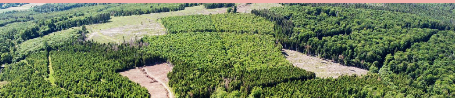
Pro Windrad muss gesunder Wald in der Grösse von rund einem Fussballfeld gerodet werden. Eine einschneidende, unwiderrufliche Veränderung der Landschaft ist die Folge. Der Wald als grösster Grundwasserspeicher wird beschädigt, Quellen werden durch die Verdichtung des Bodens zerstört.