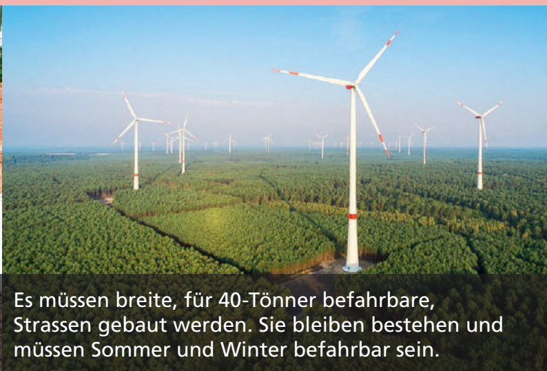
Es müssen breite, für 40-Töner befahrbare, Strassen gebaut werden. Sie bleiben bestehen und müssen Sommer und Winter befahrbar sein.