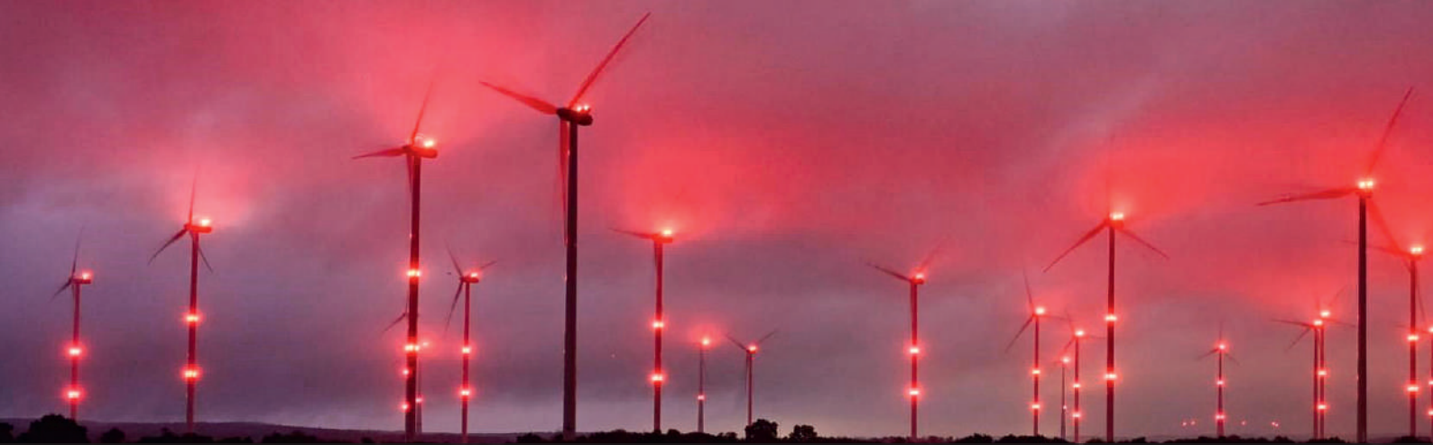
Allnächtliche Lichtverschmutzung durch Blinklichter wird zum Störfaktor für Tiere und Anwohner.