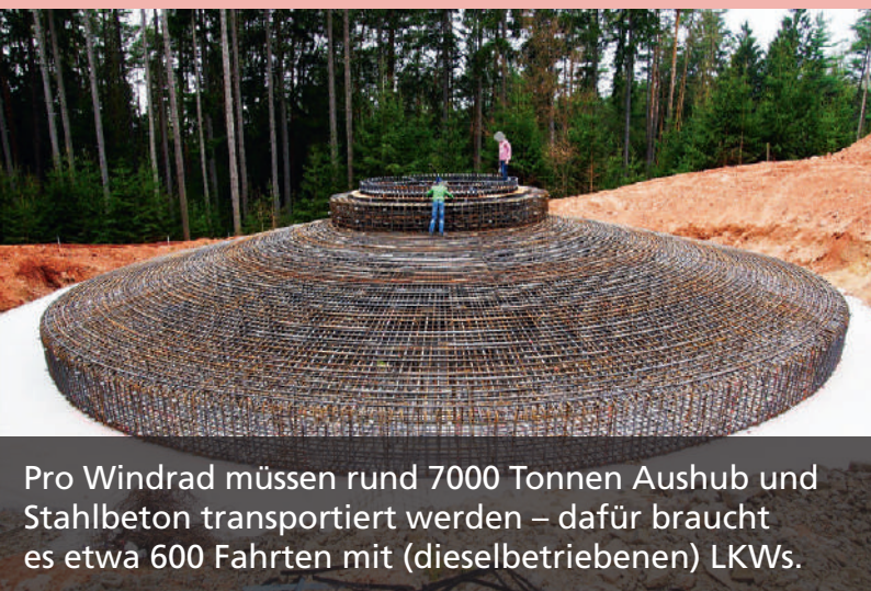
Pro Windrad müssen rund 7000 Tonnen Aushub und Stahlbeton transportiert werden – dafür braucht es etwa 600 Fahrten mit (dieselbetriebenen) LKWs.